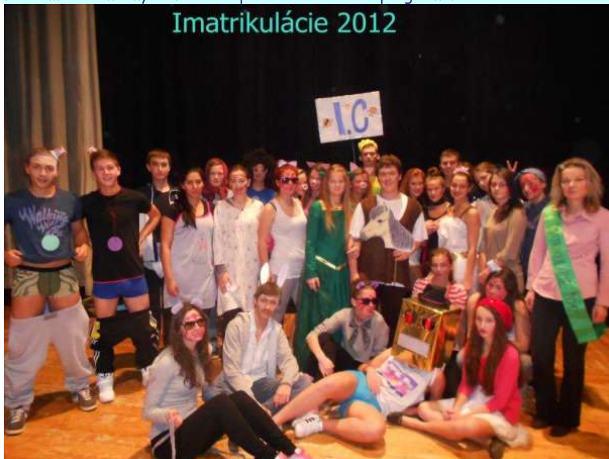
Foto: ...a to sme my - I.C tesne po zvládnutí nášho programu.