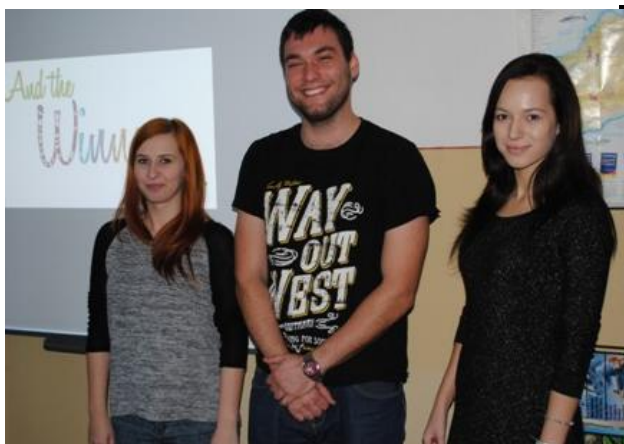
Víťazi olympiády ANJ