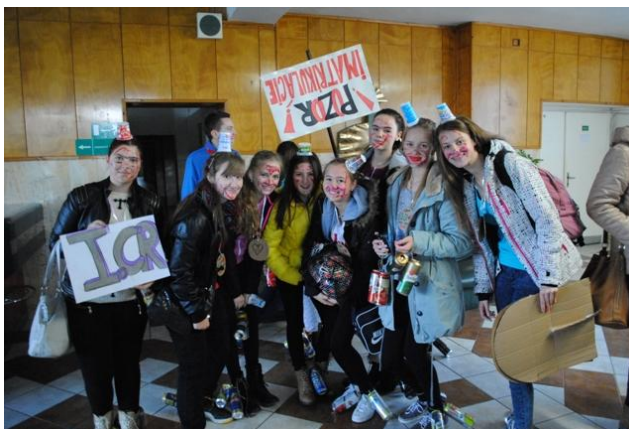
Imatrikulácie (I. CR)