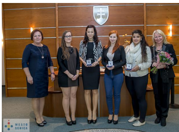
Oceňovanie študentov na radnici