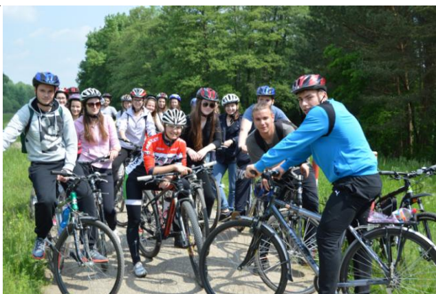
Letný kurz pohybových aktivít 2. roč