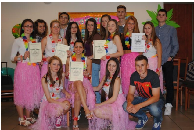
Wonderland s. r. o., výber III. C