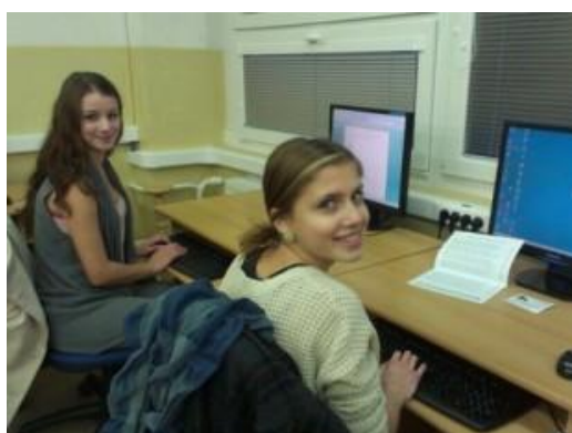
ZAV Zvolen 2014