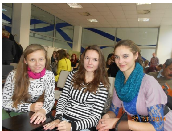
Olympiáda o EU