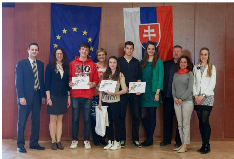
Mladý Európan, regionálne kolo, 1. miesto