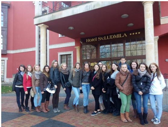
Hotel Sv. Ludmily

☐ Hotel sv. Ludmily – 11. november 2015, exkurzie sa zúčastnila III. CR, prehliadka bola rozdelená na dve časti, študenti videli konferenčné miestnosti vybavené moderným technickým zariadením, potom obdivovali útulne a vkusne zariadené izby a apartmány. Najviac ich zaujalo Relax centrum s fínskou, parnou či soľnou saunou, ktorého súčasťou sú aj krásne priestory vodného sveta. Na záver exkurzie si účastníci prezreli technické zázemie hotela a stravovacie odbytové strediská.