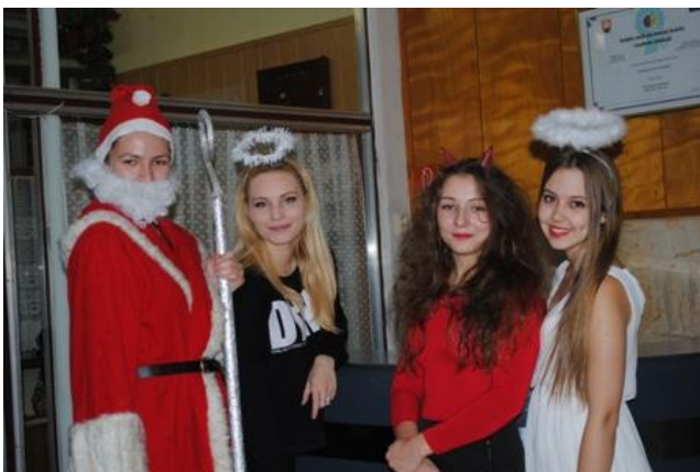
Mikuláš na obchodke (III. CR)