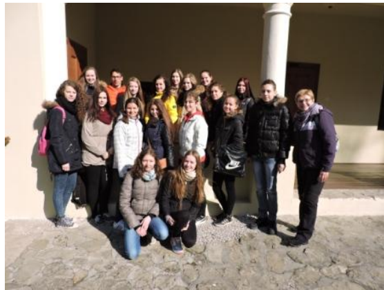
I. CR rodný dom M. R. Štefánika v Košariskách

☐ Medzinárodný veľtrh cestovného ruchu ITF Slovakiatour Bratislava – 30. januára 2015, 70 študentov odboru služby v cestovnom ruchu zamierilo do výstavných priestorov Incheby, aby si rozšírili obzor, aby získali inšpirácie, aby videli, ako dobre sa dá propagovať región, krajina, produkt. Veľkým zážitkom bola príprava a ochutnávka výbornej kávy, zmrzliny či zákuskov. V rámci sprievodných podujatí študentov zaujali vystúpenia folklórnych súborov, prezentácia zdravého životného štýlu i ukážky vábenia zveri. Medzinárodný veľtrh CR je najväčším veľtrhom CR na Slovensku a patrí medzi najvýznamnejšie podujatia v regióne strednej Európy. Veľtrh každoročne prináša komplexný servis pre ľudí, ktorí chcú cestovať do zahraničia alebo spoznávať krásy Slovenska.