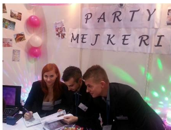
Medzinárodný veľtrh CF

► Medzinárodný veľtrh cvičných firiem – 25. - 26. 11. 2014 sa cvičná firma Party Mejkeris, s. r. o. (IV. A1) zúčastnila 17. medzinárodného veľtrhu cvičných firiem v Bratislave. Veľtrhu sa zúčastnilo množstvo domácich i zahraničných cvičných firiem, kde študenti nadväzovali obchodné kontakty, ponúkali svoje služby a snažili sa čo najlepšie