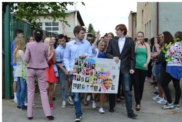
Rozlúčka 4. roč.