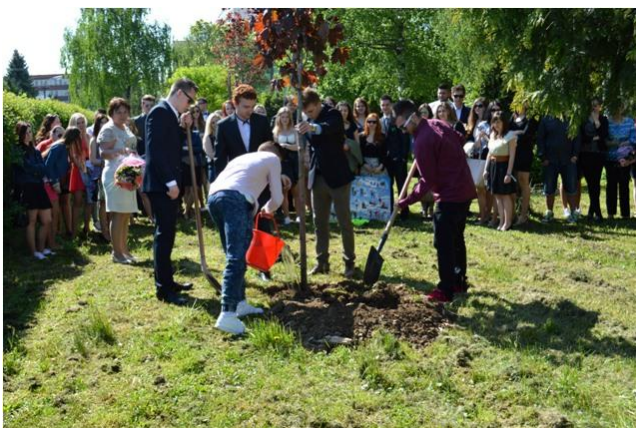
Sadenie stromčeka, 4. roč.