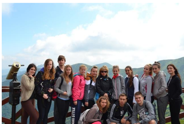
Koncoročný výlet, Vrátna