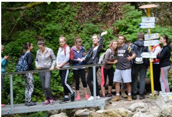
Výlet, Jánošíkove diery