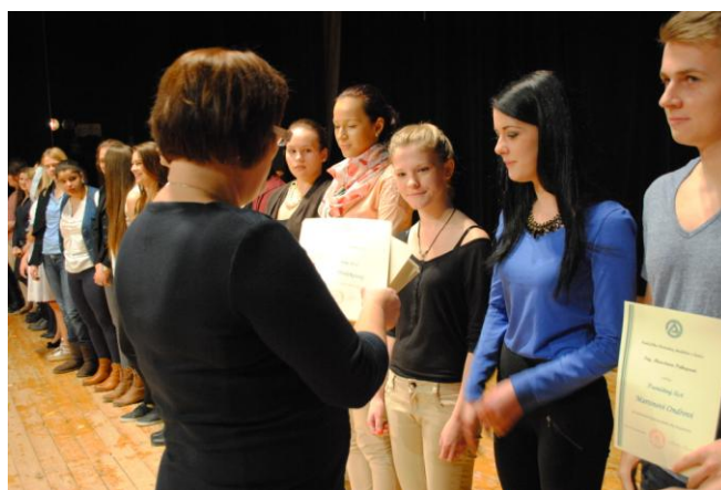
Oceňovanie študentov 4. roč.